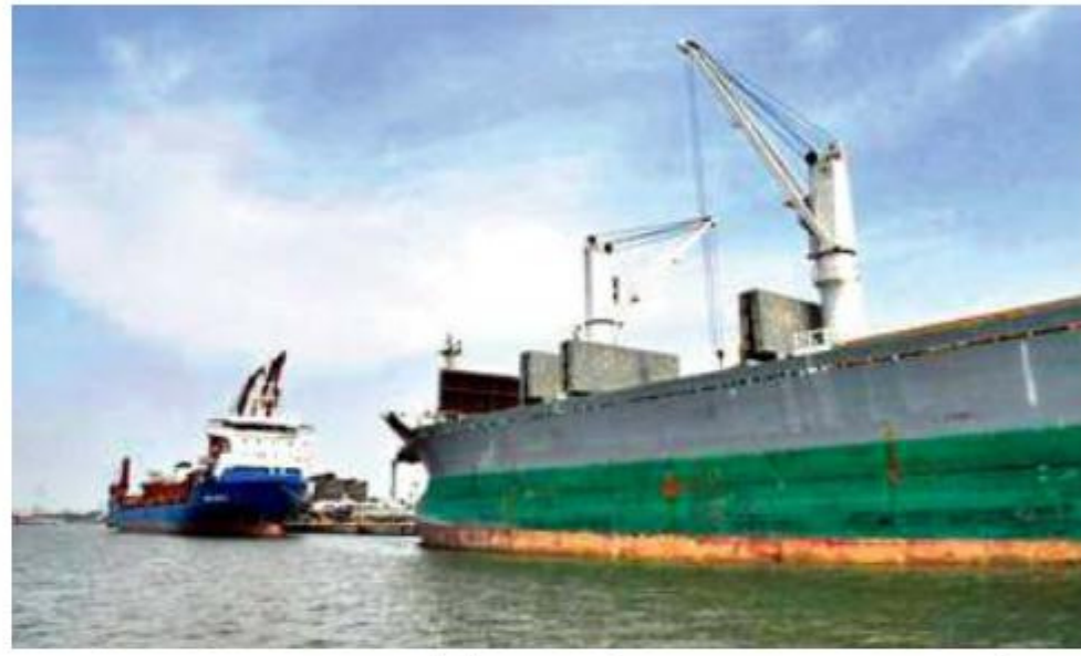
Cargo ships at Cochin Port (file photo). Concor entered coastal shipping in January last year.

Concor entered coastal shipping in January 2019, linking Deendayal Port Trust in Kandla with V O Chidambaram Port Trust in Tuticorin with stops at New