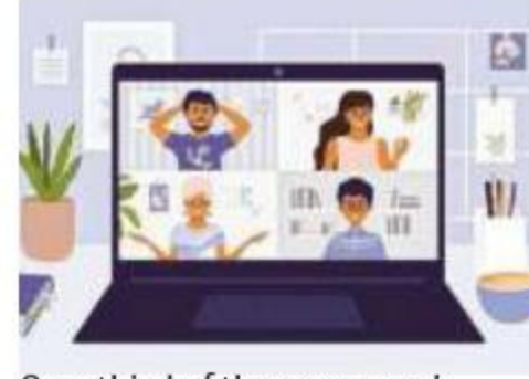
One-third of the company's workforce will work from home

Companies also see this as the new normal in terms of work-